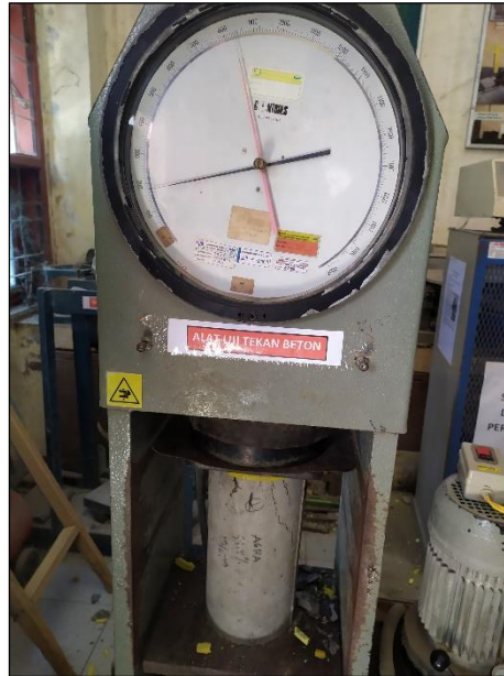
Gambar 1. Alat Uji Kuat Tekan Beton